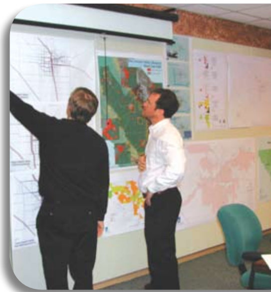
Figure 1: Ranking of approaches to issues in Kern County's future.*